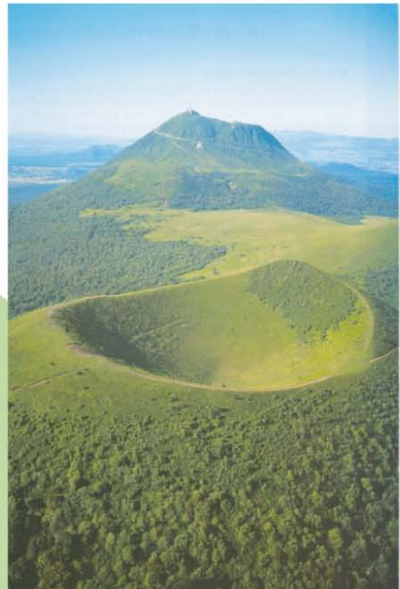
PUY DE PARIOU ET PUY DE DÔME

L' accueil est ouvert de 9h à 12h et de 14h à 20h. Vous y trouverez des informations sur les vues à faire. Des circuits touristiques sont répertoriés. Tout est mis en oeuvre afin de vous faire passer des vacances inoubliables. Un office de tourisme est également ouvert tous les jours en saison, à quelques km du camping.